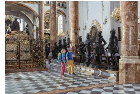
📷 L'église impériale

Tout près de la Hofburg, le Théâtre régional du Tyrol vous invite à des spectacles de