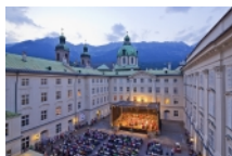
Concert de Innsbruck