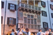
Tejadillo de Oro