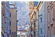
Oude stadsgedeelte Innsbruck