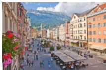
Maria Theresien Straße