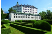
Castillo de Ambras