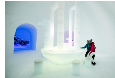
📷 ICE CAMP Kitzsteinhorn