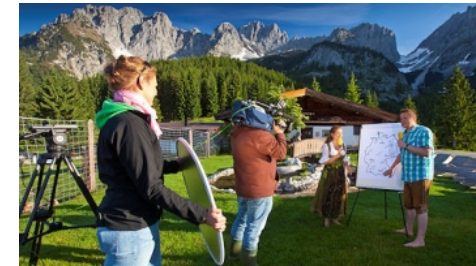
📷 Der Wettergipfel 2012 am Wilden Kaiser

Unzählige TV-Kamerateams wieselten mit ihren Wettermoderator/inn/en durch die Region, um entweder als Aufzeichnung oder als Live-Schaltung das aktuelle Wetter für ein