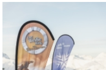
LZTG / Christoph Schoech